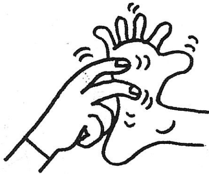
6. Wee-wee-wee-wee-wee, I can't find my way home ウィーウィーウィーウィーウィーぼくのおうちはどこだろう 足のうらをくすぐる