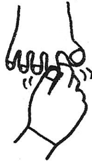
2. This little pig stayed at home. このゆび コブタ おるすばん