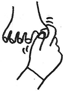
1. This little pig went to market. このゆび コブタ マーケット