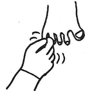
5. This little pig cried, このゆび コブタ なきだして