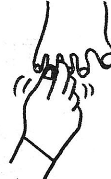
4. This little pig had none, このゆび コブタ なんにもない