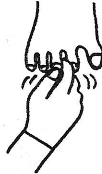
3. This little pig had roast beef, このゆび コブタ ローストビーフ